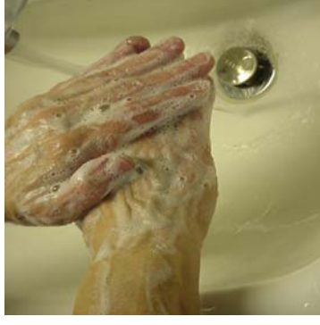
Paso 4: Enjabonar y lavar las manos y antebrazo fuera del agua por 20 segundos.

Cada Empleada Debe Lavarse las manos Completamente Usando Javon, Agua Tibia Y Toallas Sanitaria O Aparato Aprobado de Secado de Manos, Antes de Empezar a Trabajar y Despues de Cada Vista al Toilet. (Cuarto de Bano) Por Orden de Carolina de Norte Departamento de Medio Ambiente de Salud, Raleigh, N.C.