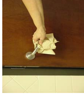
Paso 9: Abrir la puerta con papel.