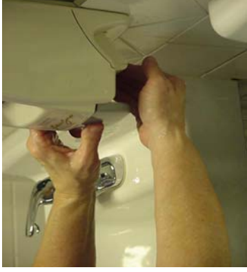
Paso 3: Aplicar javon antibacterial.