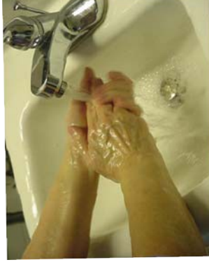
Paso 6: Enjuague por 10 segundos, incluso antebrazos.