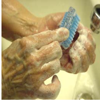
Paso 5: Use cepillo de unñas para limpiar debajo de las unñas. Notas: Siempre mantenga un cepillo limpo e higienico.