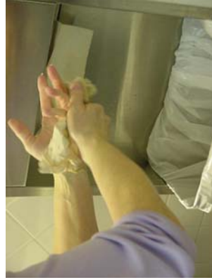
Paso 7: Secar las manos completamente.