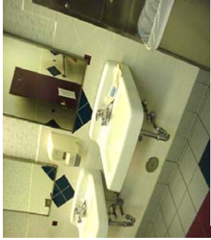
Paso 1: Estacion completa de lavado de manos.